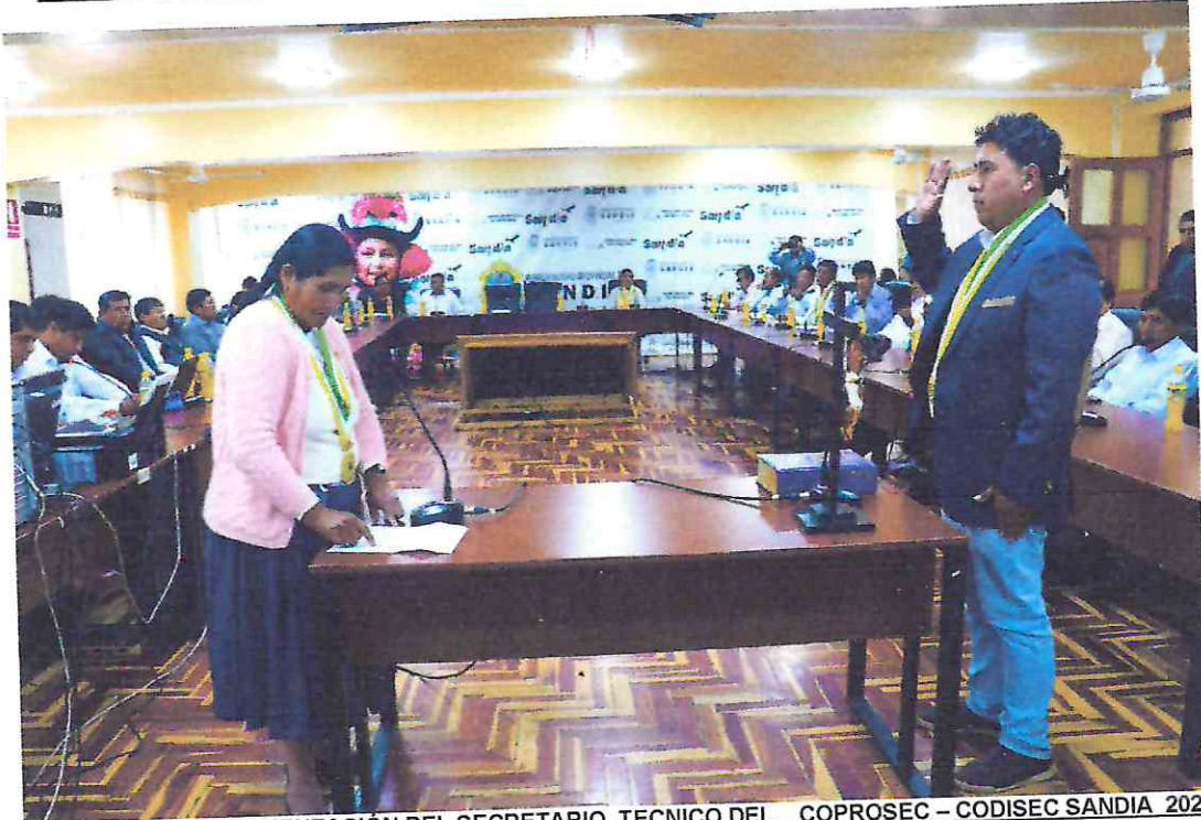
JURAMENTACIÓN DEL SECRETARIO TECNICO DEL COPROSEC – CODISEC SANDIA 2023