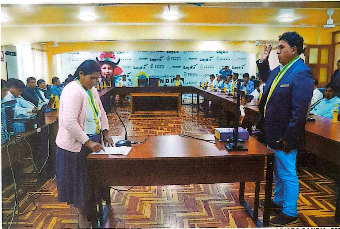
JURAMENTACIÓN DEL SECRETARIO TECNICO DEL COPROSEC – CODISEC SANDIA 2023